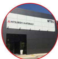
SPAGNA MTEC Valencia