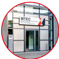
GERMANIA MTEC Stuttgart