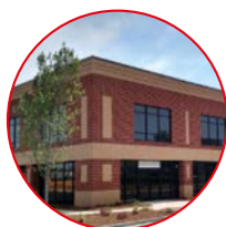
STATI UNITI MTEC North Carolina